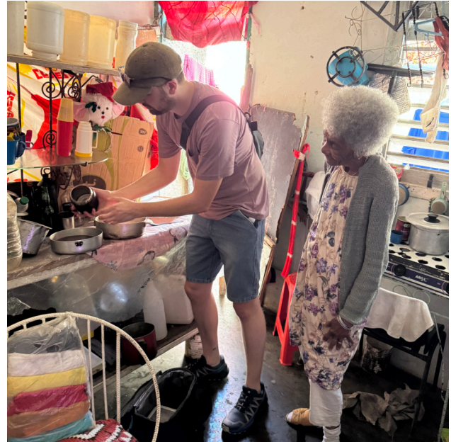
Distribution du repas de la cantina chez Regla

Les enfants imaginent les décors, les dessinent, les découpent dans du papier, puis projettent leurs créations sur une toile blanche. C'est un espace où ils et elles peuvent stimuler leur créativité, s'exprimer librement et, l'espace d'un instant, oublier les difficultés du quotidien.