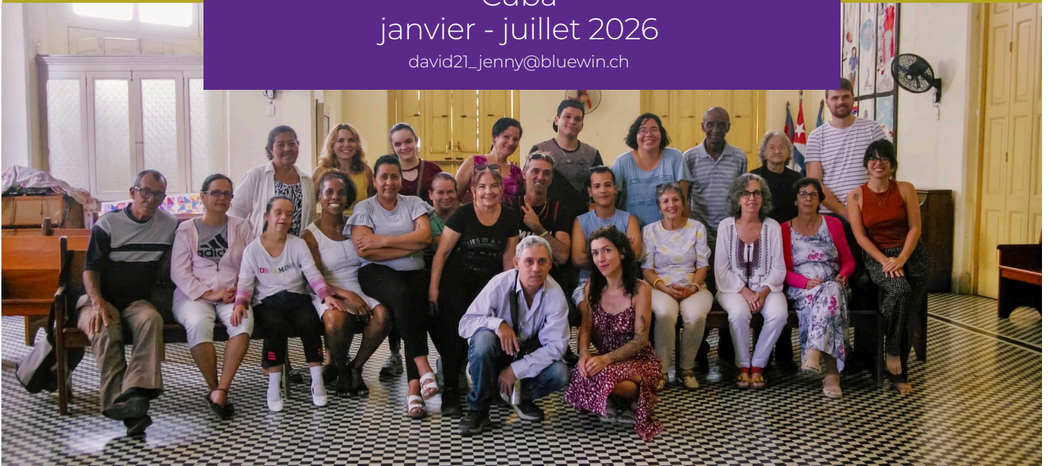
L'équipe du Centre Kairos lors de l'évaluation annuelle 2025

L'association DM est active dans l'agroécologie, l'éducation et le vivre ensemble en Afrique, en Amérique latine, au Moyen-Orient, dans l'océan Indien et en Suisse.