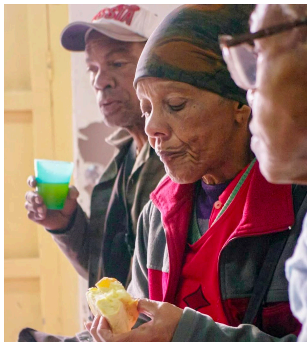
Distribution du petit-déjeuner aux personnes en situation de vulnérabilité

Récemment, une église catholique proche du centre a proposé d'offrir elle-même le petit-déjeuner deux fois par semaine pour les mêmes bénéficiaires, afin de soulager le Centre Kairos. Ce geste illustre magnifiquement bien la solidarité locale.