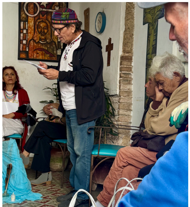
Récitation de poème pour les personnes du 3ème âge

Afin d'économiser le carburant, certaines mesures ont été mises en place : les enfants vont désormais à l'école uniquement le matin, et dans certains secteurs, la semaine de travail est passée de cinq à quatre jours. La situation est réellement préoccupante pour la population.