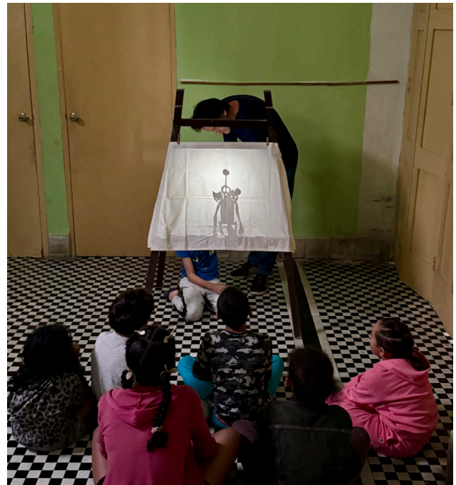
Cours de théâtre d'ombres avec les enfants du « Taller Mani-obras »