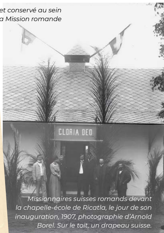
Missionnaires suisses romands devant la chapelle-école de Ricatla, le jour de son inauguration, 1907. Sur le toit, un drapeau suisse.

masque parfois des déséquilibres structurels importants, entre autres en ce qui concerne l’accès aux ressources, la définition des priorités et la capacité d’influence institutionnelle. Une « christianité coloniale », selon les termes du pasteur et président de l’Université internationale des Caraïbes,