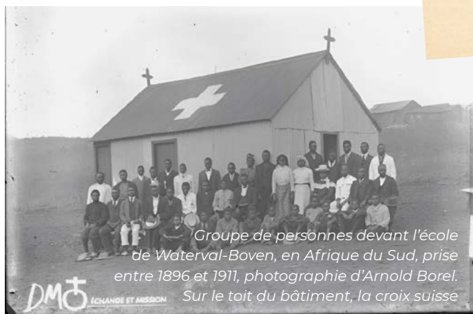
Groupe de personnes devant l’école de Waterval-Boven, en Afrique du Sud, prise entre 1896 et 1911. Sur le toit du bâtiment, la croix suisse