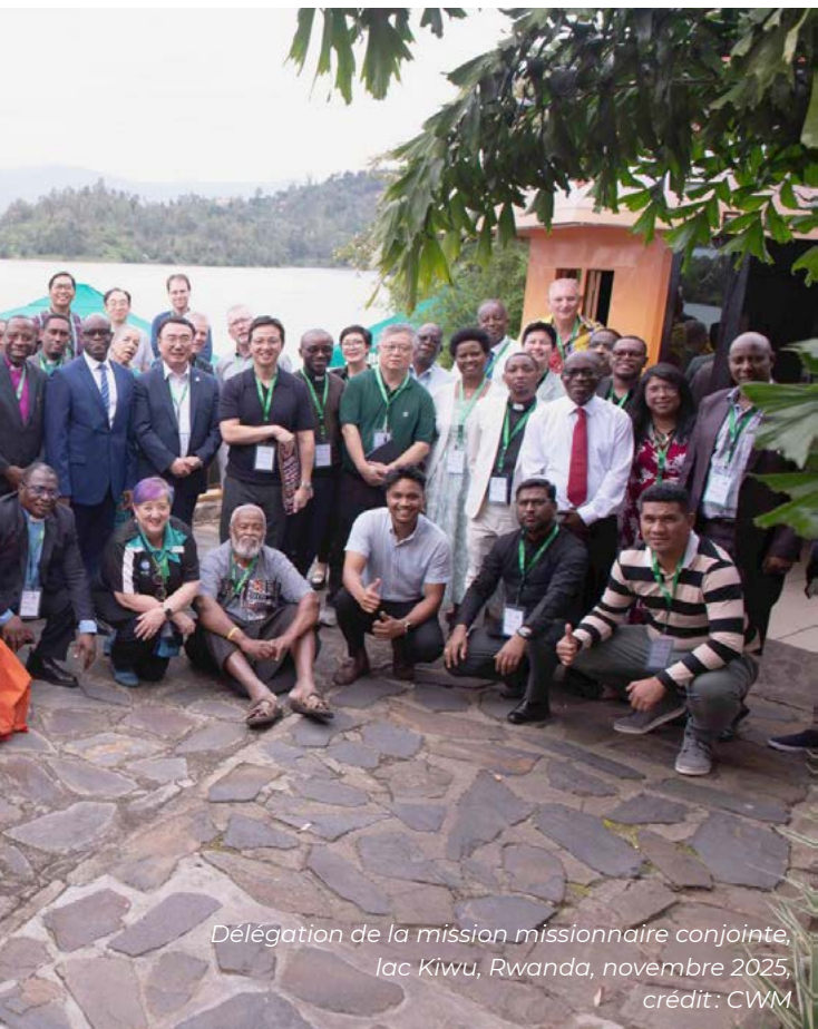
Délégation de la mission missionnaire conjointe, lac Kivu, Rwanda, novembre 2025, crédit: CWM