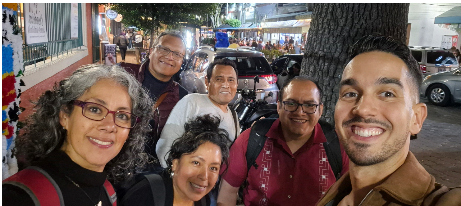
Dernière photo d'équipe de mon repas de départ à Coyoacan

Les moments de convivialité, d'échanges et les rires résonneront pendant longtemps dans ma tête et je me réjouis déjà de vous retrouver la prochaine fois