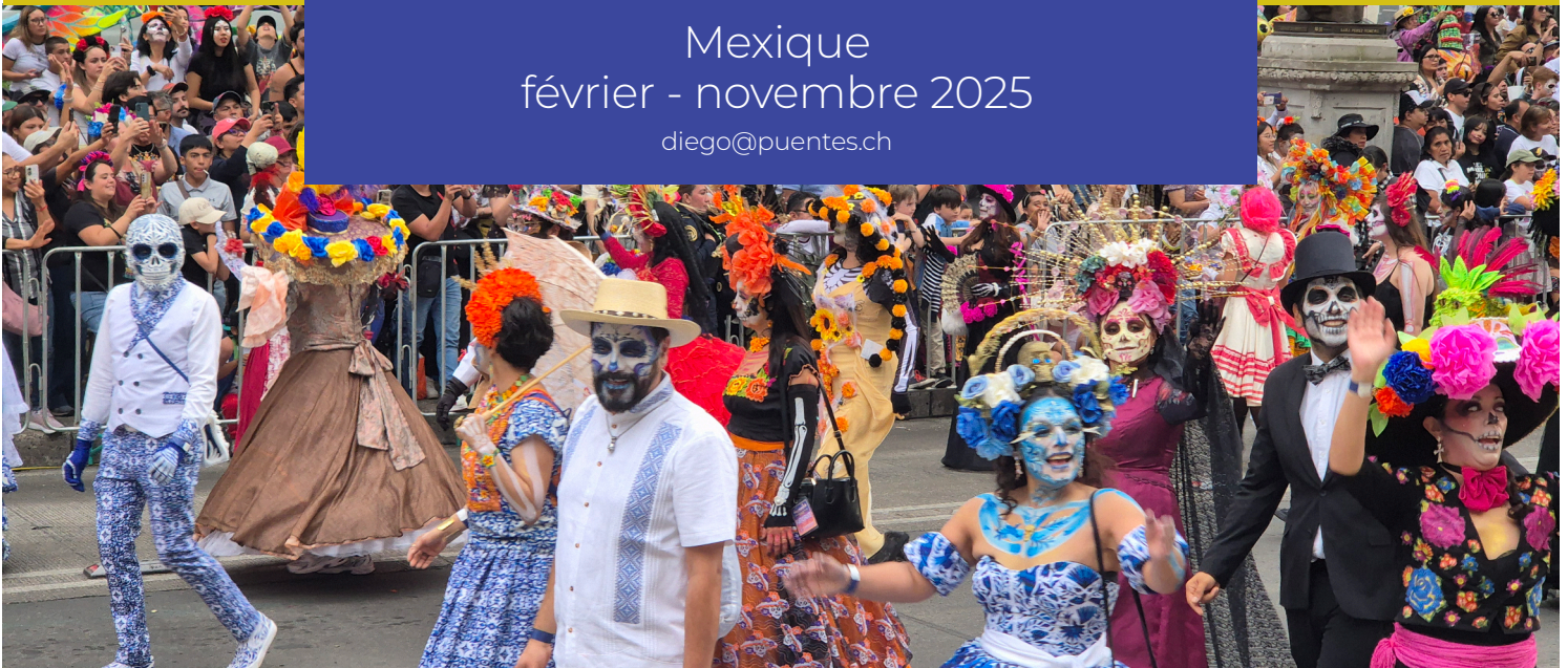
Défilé coloré de la Fête des morts

Mexique février - novembre 2025 diego@puentes.ch