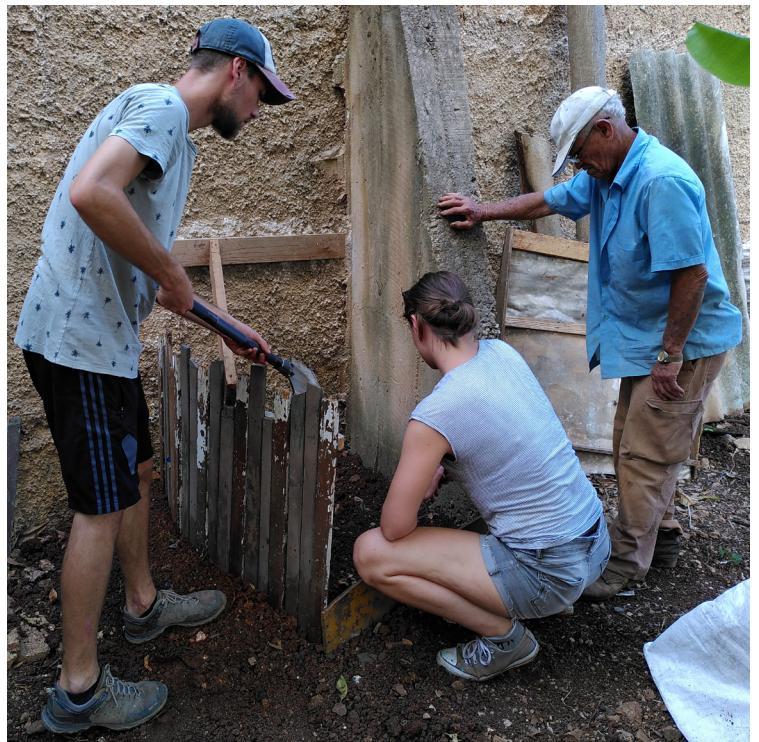
Préparation d'un compost à San Nicolas de Bari avec le groupe de jeunes de Soleure