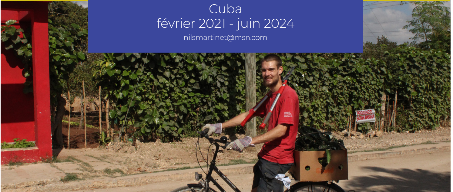
Mes déplacements au travail, février 2023

L'association DM est active dans l'agroécologie, l'éducation et la théologie en Afrique, en Amérique latine, au Moyen-Orient, dans l'océan Indien et en Suisse.