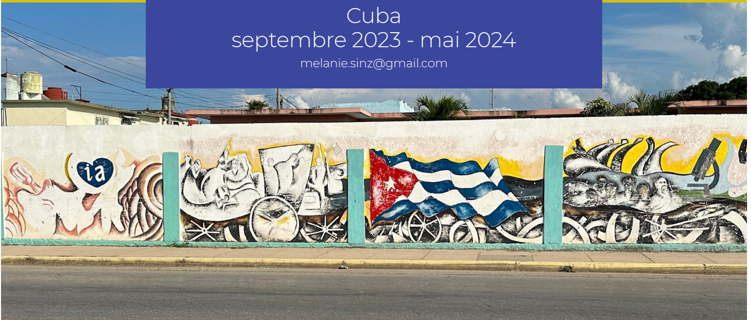
Mur de graffitis en direction du centre-ville de Cardenas

Cuba septembre 2023 - mai 2024 melanie.sinz@gmail.com