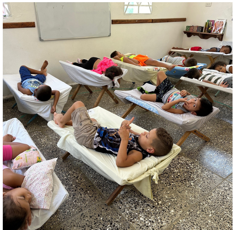
Étude biblique des enfants à Guanabacoa au moment de la sieste