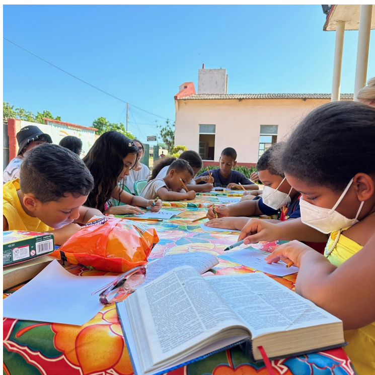
Moment de bricolage à l'école du dimanche

Le dimanche 17 septembre, il y avait l'école du dimanche pour les jeunes de la paroisse. Il y avait dix enfants et cinq adolescent.es. Nous avons d'abord fait un tour de présentation avec notre prénom, raconté ce que l'on aime puis on a chanté une chanson en espagnol qui disait : Qu'il était bon que Dieu soit là, cela réjouit mon cœur, c'est une joie de pouvoir dire que Dieu te bénisse. Tellement beau et en espagnol c'est encore plus beau qu'en français, très touchant. Puis les animatrices ont raconté l'histoire de la tour de Babel, avec une improvisation d'une pièce de théâtre dont j'ai bien sûr fait partie en parlant le français, l'allemand et l'anglais pour dire bonjour. Ensuite, le moment d'enseignement sur un tableau avec des craies. Pour conclure cette partie et avant de rejoindre les adultes, un moment artistique, les enfants devaient dessiner la tour de Babel. Cela me rappelle un peu l'éveil à la foi dans ma paroisse... j'y ai bien pensé.