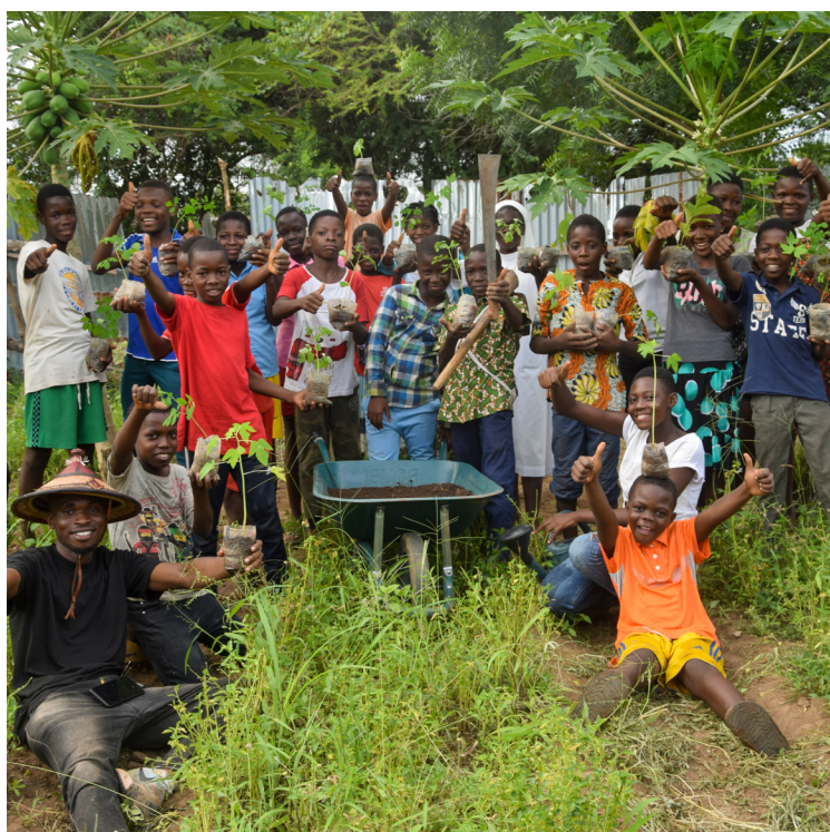
Journée de l'Arbre au Togo dans le jardin d'une école

En avril, nous avons créé des pépinières d'arbres fruitiers avec les élèves et nous avons planté une partie de ces jeunes plants le 1er juin, à l'occasion de la Journée de l'Arbre au Togo. Cette journée, instaurée en 1977, encourage les Togolais.es à planter des arbres pour symboliser le reboisement et la protection de l'environnement. Le gouvernement togolais en se basant sur des données de 1990 à 2015 estime que « la surface forestière diminue d'environ 5679 ha par an, contre un reboisement en moyenne de 2000 ha par an. La perte annuelle ainsi enregistrée s'élève à 3679 hectares, soit 5 518 500 arbres ! ». Il faut souligner que tous les arbres plantés en cette journée n'arrivent pas à maturité et certains meurent faute d'entretien et de protection contre les animaux. En responsabilisant chaque élève pour un ou deux arbres, nous espérons améliorer le taux de réussite de ces plantations.