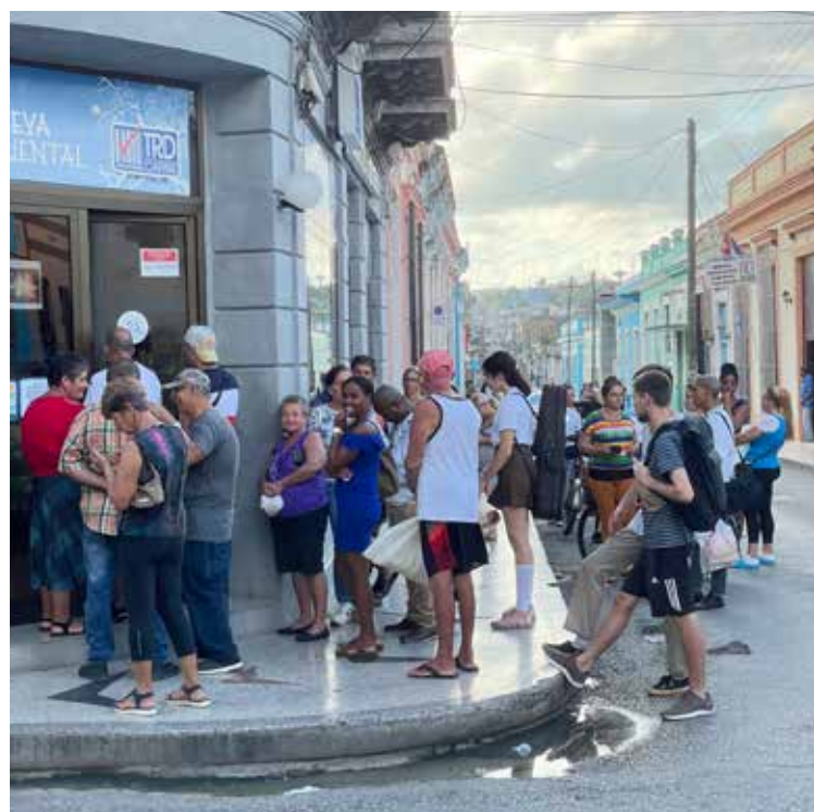
Une heure de queue pour du papier sanitaire.

Pour être honnête, le plus difficile à voir c'est effectivement le manque de nourriture et les difficultés pour s'en procurer: rentrer dans des magasins et voir les étagères vides, ou faire la queue durant 3h pour quelques morceaux de poulet,... Par exemple, l'époux de ma responsable a fait la queue pendant 5h, jusqu'à 22h30 pour pouvoir acheter 2,5 kg de viande pour Noël... Ou même une anecdote personnelle: il m'a fallu un mois et demi pour