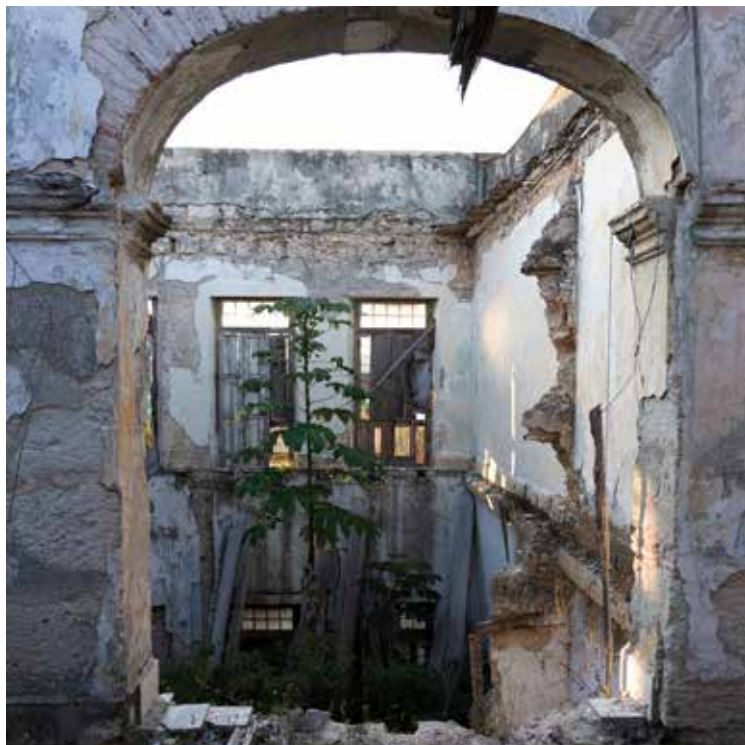
Projet de rénovation.