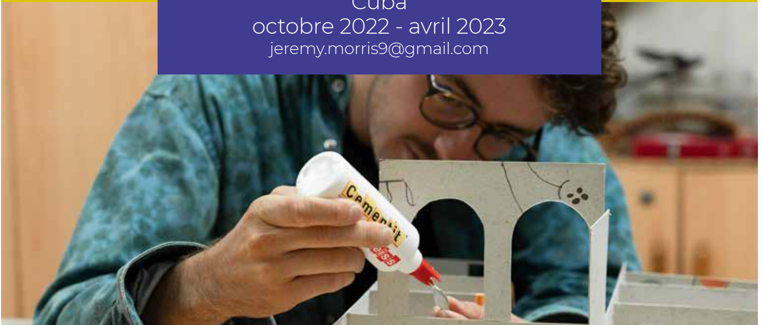
Réalisation d'une maquette et plans de rénovation.

L'association DM est active dans l'agroécologie, l'éducation et la théologie en Afrique, en Amérique latine, au Moyen-Orient, dans l'océan Indien et en Suisse.