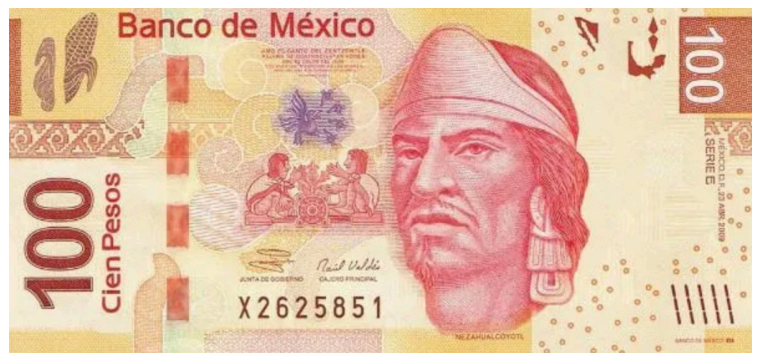
Billet de 100 pesos (MXN) avec le portrait de Nezahualcoyotl.

Dans la maison du printemps tu donnes de la joie aux gens.