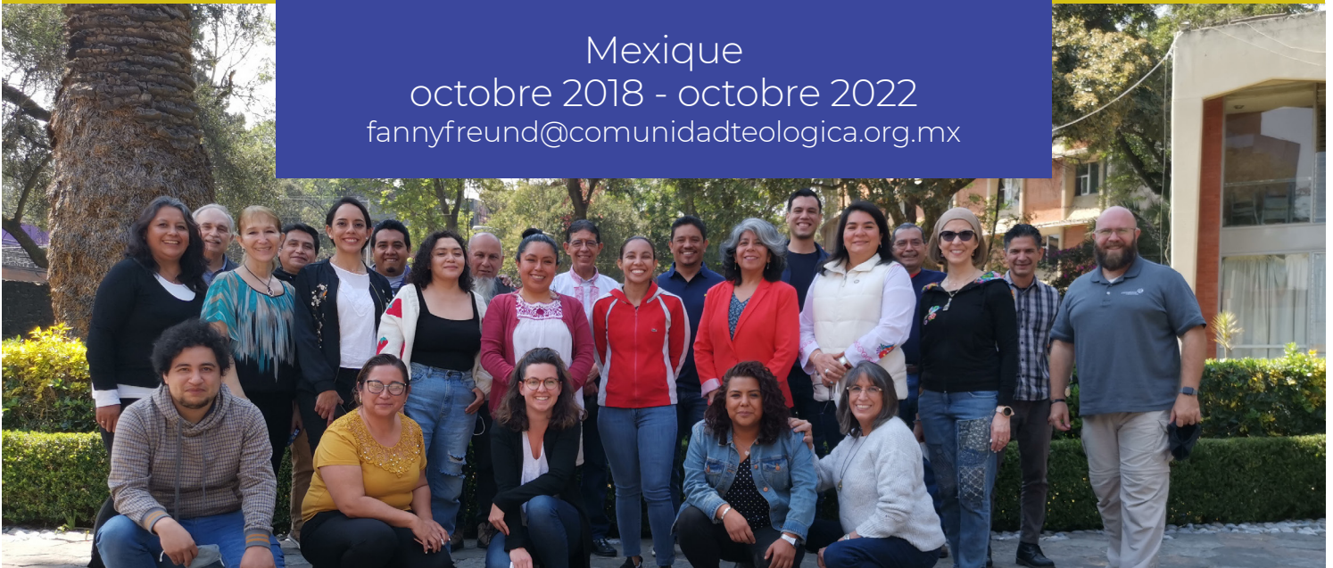
Les étudiant.e.s, professeur.e.s du Master en études théologiques et collègues du Séminaire Baptiste qui accompagnent l'événement.

Mexique octobre 2018 - octobre 2022 fannyfreund@comunidadteologica.org.mx