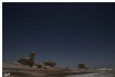
Nuit étoilée dans le désert 17 (Désert blanc)