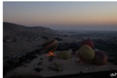
Préparatifs de décollage 7 (Luxor)