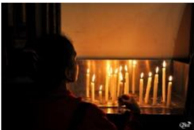
Lueur d'espoir 47 (Eglise suspendue Sainte-Marie) (Caire)