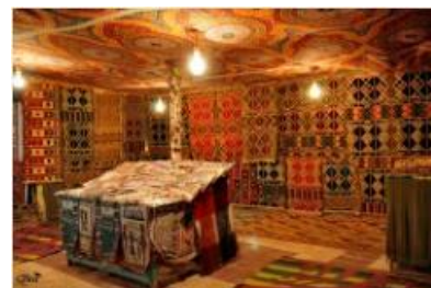
Tapissérie au village nubien 11 (Assouan)