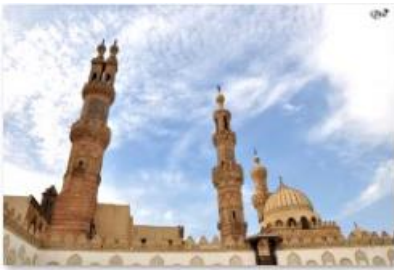
Mosquée El Azhar (Caire)