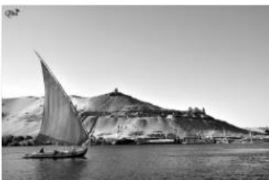
Felouque sur le Nil 10 (Assouan)