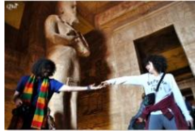
Connexion 25 (Abou Simbel)