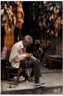
Fabrication de chaussures 42 (Caire)