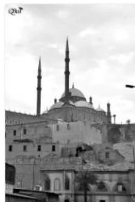
Mosquée Mohammed Ali 60 (Caire)