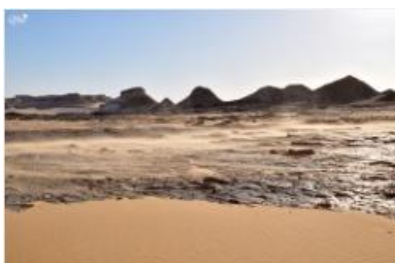
Vue panoramique 20 (Désert noir)