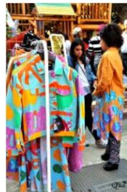
Vendeuse d'habits à un marché de Noël 39 (Caire)