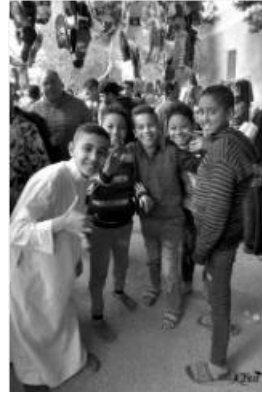
enfants s'amusant au marché 35 (Marché du vendredi) (Caire)