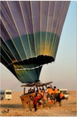
Atterrissage à l'aide de travailleurs 26 (Luxor)