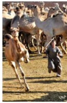
Marché des dromadaires 43 (Birqash)