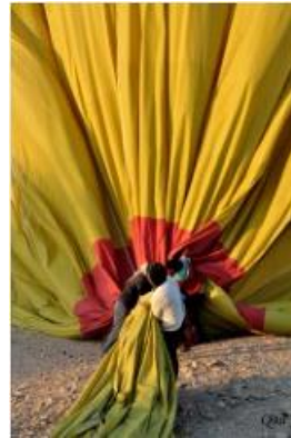
Pliage de la mongolfière 27 (Luxor)