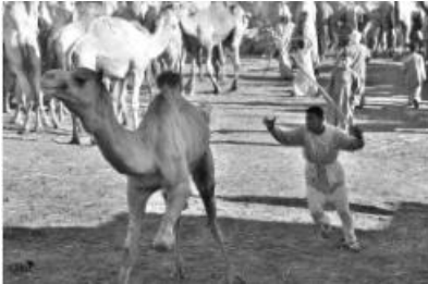
Marché des dromadaires 44 (Birqash)