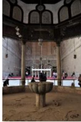
Espace de prière 54 (Mosquée) (Caire)