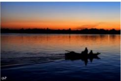
Pêcheurs 28 (Nil)