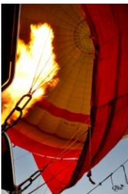
Acension 8 (Luxor)