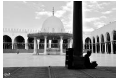
Lecture 48 (Mosquée Amr ibn al-As) (Caire)