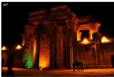
Temple de Kom Ombo 12 (Kom Ombo)