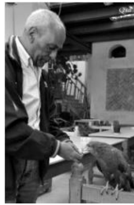
Patron d'un restaurant nourrissant son faucon 33 (Luxor)