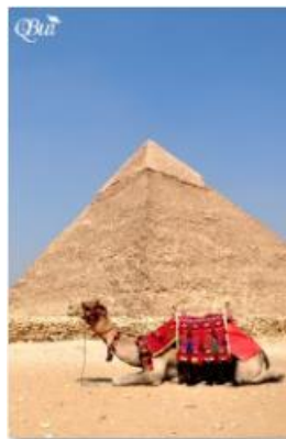
Pyramide de Gizah 13 (Caire)