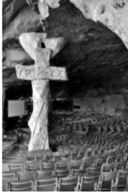
Espace de prière 53 (Eglise de Saint-Marc) (Caire)