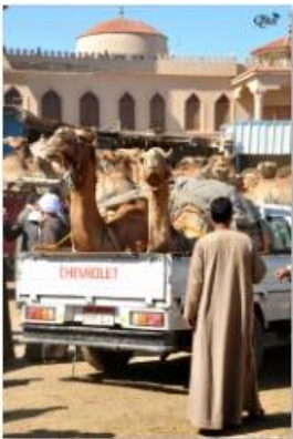
Marché des dromadaires 46 (Birqash)