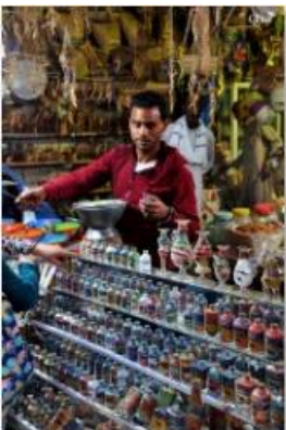
Marchand de sable au village nubien 36 (Assouan)