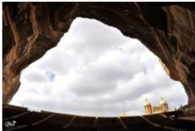
Vue du ciel 55 (Monastère St-Simon le Tanneur) (Caire)