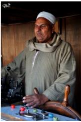
Capitaine de bateau de croisière 32 (Assouan – Luxor)