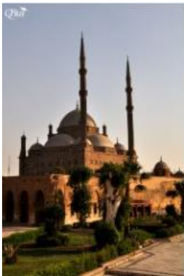
Mosquée Mohammed Ali 59 (Caire)