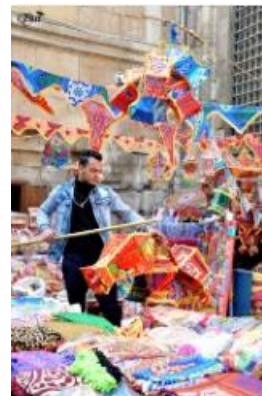
Vendeur de lampions 37 (Caire)