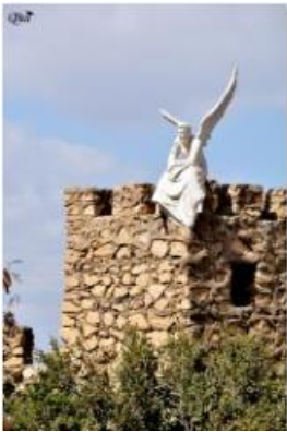
Un ange attend 57 (Quartier des églises À Mokattam) (Caire)