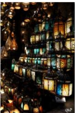
Etalage de lampe À Khan El-Halili 38 (Caire)