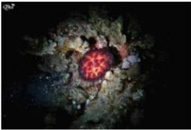
Oursin 3 (Marsa Alam)