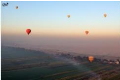
Mongolfières à côté de la vallée des rois 6 (Luxor)