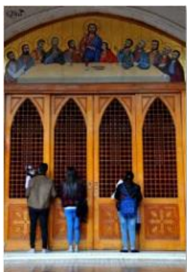
Instant de prière 49 (Monastère St-Simon le Tanneur) (Caire)