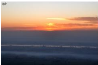
Lever de soleil sur le Nil 14 (Luxor)