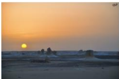
Lever du soleil dans le désert 16 (Désert blanc)