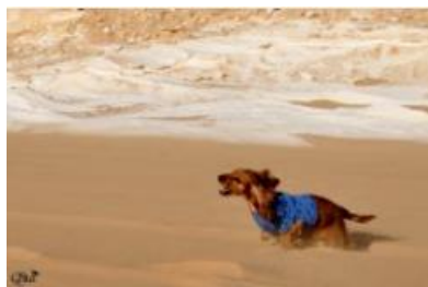
Cocker du désert 21 (Désert noir)