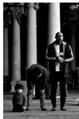
Instant de prière 50 (Mosquée Amr ibn al-As) (Caire)