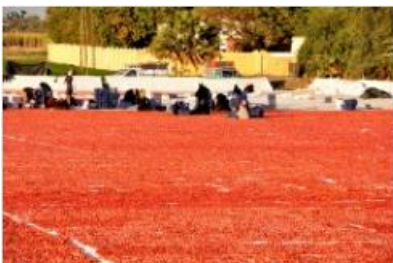
Préparation de Tomates séchées 30 (Luxor)