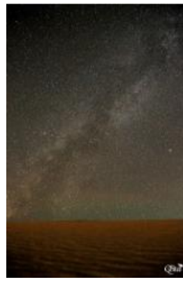
Voie lactée 23 (Désert de Siwa)