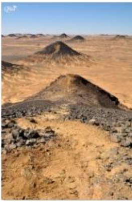
Vue panoramique 22 (Désert noir)