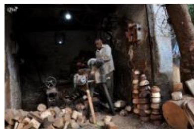
Fabrication de bols en bois 41 (Caire)