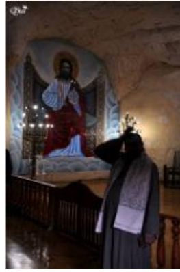
Instant de prière 52 (Monastère St-Simon le Tanneur) (Caire)