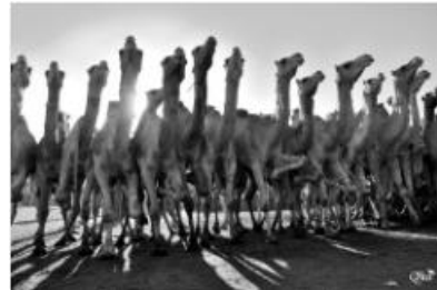
Marché des dromadaires 45 (Birqash)