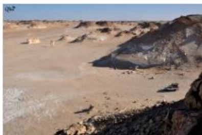
Vue panoramique 18 (Désert noir)