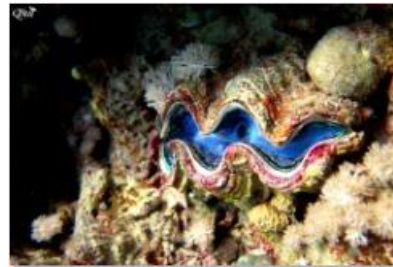
Bénitier 4 (Marsa Alam)