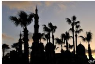
Vue du ciel 56 (mosquée) (Alexandrie)