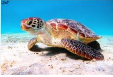
Tortue de mer 1 (Marsa Alam)