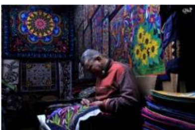
Fabrication d'une nouvelle broderie 40 (Caire)