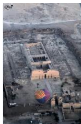
Temple de Médinet Habou 9 (Luxor)