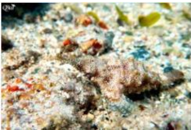
Bébé 5 (Marsa Alam)