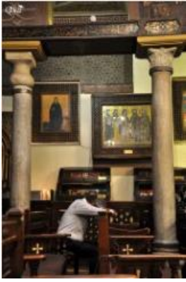
Instant de prière 51 (Eglise suspendue Sainte-Marie) (Caire)