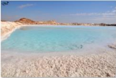
Lac de sel 24 (Siwa)