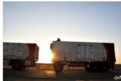
Convoyeurs 29 (Route de la Côte Nord)