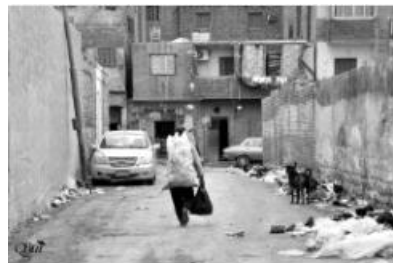
Ramasseur de déchets 31 (Marché du Vendredi) (Caire)