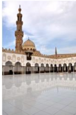
Réflexion après la pluie 58 (Mosquée El Azhar) (Caire)