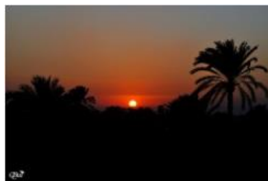
Coucher de soleil 15 (Luxor)