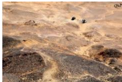
Vue panoramique 19 (Désert noir)