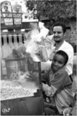
Vendeur de popcorn avec son fils 34 (Marché du vendredi) (Caire)