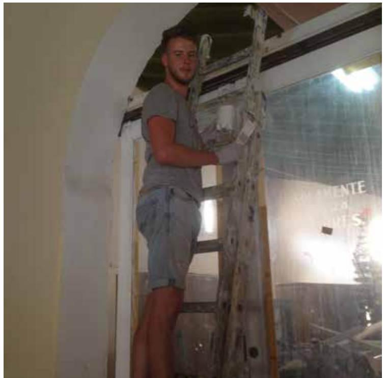
À Cuba, c'était le pinceau, à quoi ressembleront mes outils au Togo ?