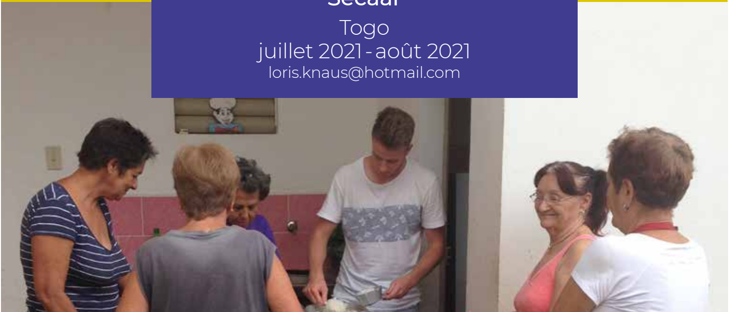
À chacune sa portion de riz à Remedios.

Togo juillet 2021 - août 2021 loris.knaus@hotmail.com