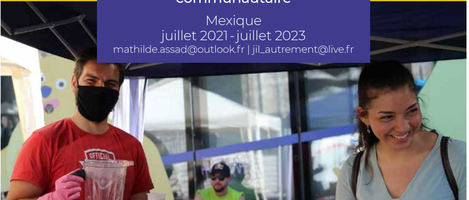
Distribution de smoothies avec le Service Pâques.

Mexique juillet 2021 - juillet 2023 mathilde.assad@outlook.fr | jilLautrement@live.fr