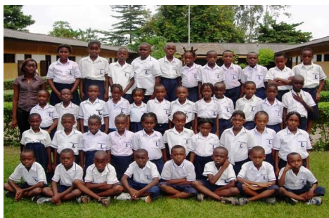
Vue d'une classe de la 3 ème Primaire de Lisanga

Objectif : Participer au programme des festivités marquant les 40 ans de l'Ecole Lisanga, visiter l'école, échanger avec le personnel de Lisanga, les élèves parrainés, leurs parents et membres des familles, découvrir le Congo profond (visite des institutions, excursions vers les sites historiques et touristiques de Kinshasa et du Kongo Central).