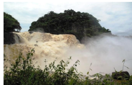
Chutes de Zongo (Kongo Central)

Programme : - 16 mai: voyage Suisse - Kinshasa, arrivée, accueil, installation - du 17 au 20 mai: Découverte de l'école et de la ville de Kinshasa avec ses différentes facettes. Visite de différents sites des environs: Chutes de la Lukaya, Sanctuaire des Bonobos, Parc Présidentiel, le grand fleuve Congo. - du 21 au 24 mai: Participation aux festivités marquant les 40 ans de l'école Lisanga. Contact avec les élèves, les enseignants et les familles des filleuls. - du 25 au 27 mai: Découverte du Congo profond: Chutes de Zongo, Hôpital de Kimpese et Jardin Botanique de Kisantu. - 28 mai: Retour en Suisse.