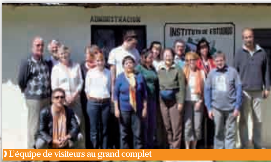
L'équipe de visiteurs au grand complet

Ils étaient dix-sept, issus de huit Eglises. Des francophones et des alémaniques, des femmes et des hommes, des laïcs et des ministres. Pour cette session de formation continue de pasteurs suisses, le voyage a débuté par trois jours à Mexico, avant de prendre ses quartiers à l'Institut interculturel d'études et de recherche (INESIN), à San Cristóbal de Las Casas. Un séjour pour comprendre les préoccupations de ce pays : migration, situation des femmes, spiritualité maya chrétienne ou encore travail pour la paix. Une interpellation pour l'équipe suisse, impressionnée par les multiples implications sociales des intervenants, ministres et laïcs.